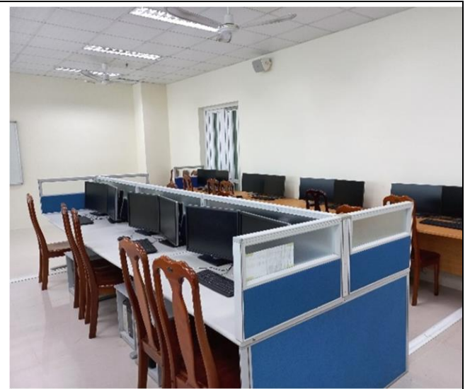
Bàn máy tính sinh viên